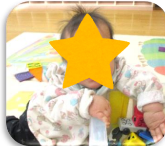
玩具箱によいしょっと もたれかかるさあやちゃん♪