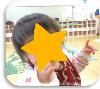
「はいチーズ」でポーズを 決めるきゅちゃん(笑)