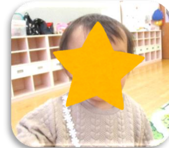
カメラに近付いてじっと 見つめるにこちゃん！