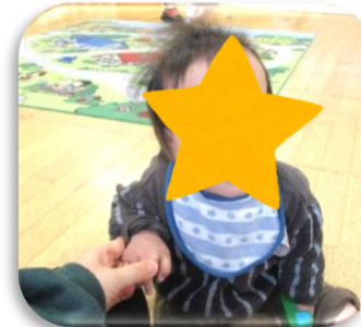
早く給食のご飯が 食べたいおうがくん！