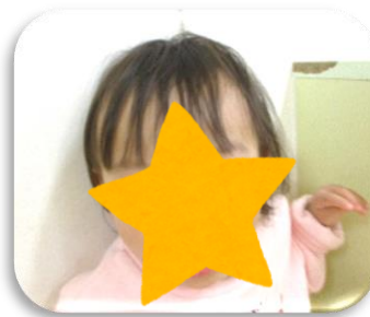
「がおー！」と機嫌よく 逃げ回るしきくん♪