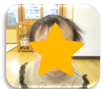
不意打ちで撮られた しゅうはくん(笑)