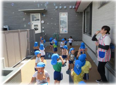
わぁ〜シャボン玉がいっぱい♡

梅雨はまだまだ続き、少しずつ暑くなる日々が夏の季節がきたと感じるこの頃。たんぽぽ組の子どもたちは暑さに負けず元気いっぱい過ごしています♪最近、手遊びがブームで『かみなりどんがやってきた』、『トーマスの手遊び』など楽しく自分たちで歌いながらしている姿が見られます。是非、お家でも子どもたちとしてみてください(*^^*)