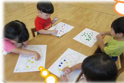
上手に貼れるかな(*^^*)