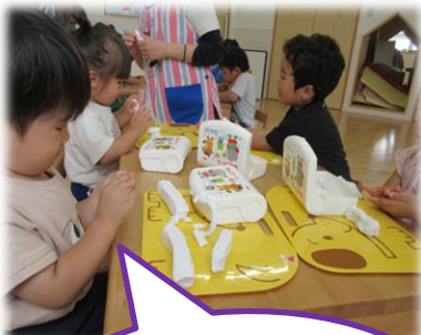
こねこね〜丸く 出来るかな♪